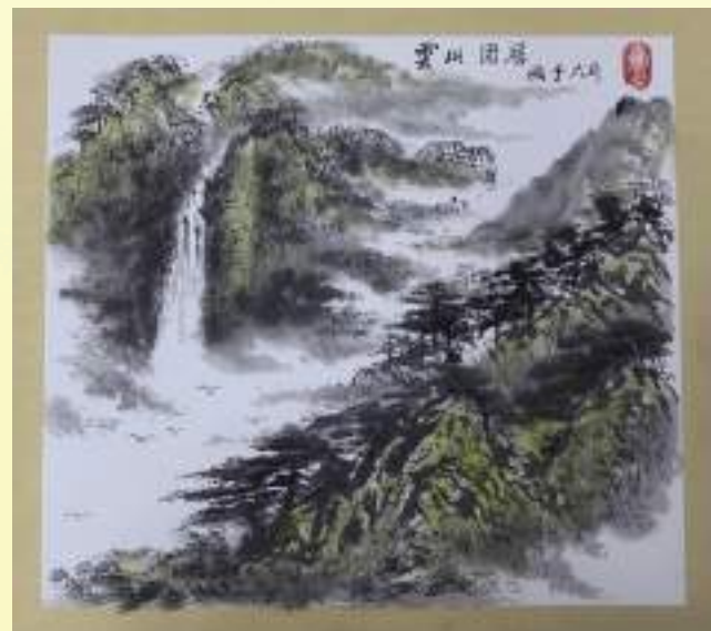
孔宪玉《云山固居》绘画类第三名