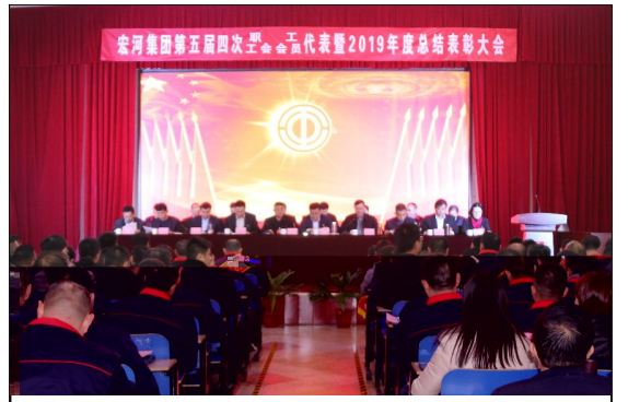
1 a 19日, 宏河集团第五届四次职代会(工代会)暨2019年度总结表彰大会在横河煤矿职工bc召开。

! " # $ % & ' ( ) * + , ) * - . 2019 / 01 2345 * 67, 89: +; <-